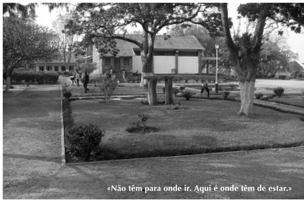
«Não têm para onde ir. Aqui é onde têm de estar.»

De onde és?, perguntei a um outro. Ele respondeu: «De Luanda. Lá, vivia na rua e ganhava a vida pedindo ou fazendo recados. Disseram-me que meu pai vivia em Calomboloca (uma vila a quarenta quilómetros de Luanda). Assim, fui até lá. Quando cheguei, o meu pai não quis